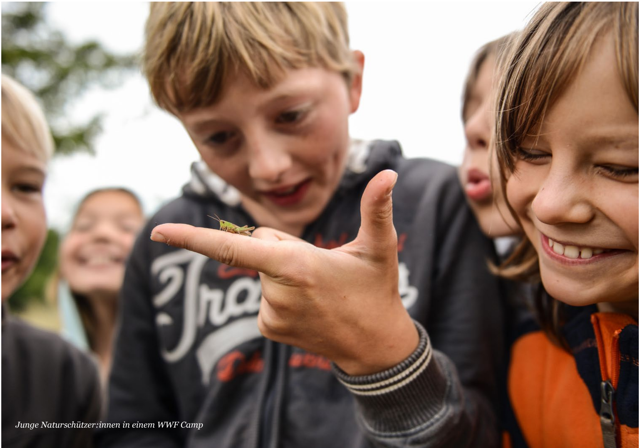
Junge Naturschützer:innen in einem WWF Camp