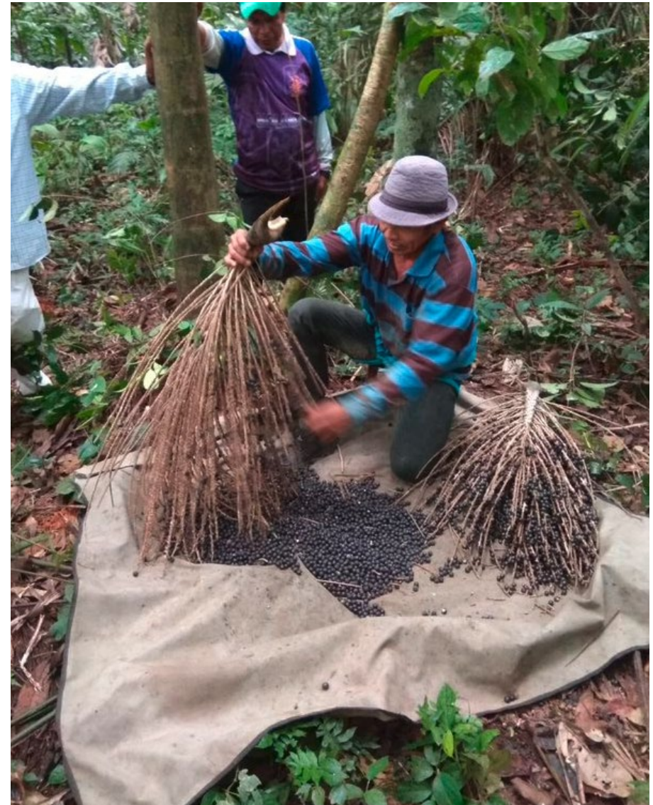
Acai-Beeren-Ernte im Projekt