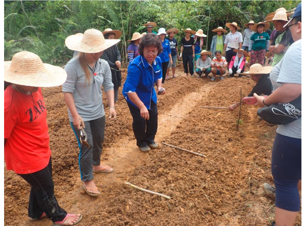
Trainingsprogramm zur Subsistenzlandwirtschaft

Der Schwerpunkt der Arbeit im Kuba'an-Puak Cluster liegt in der Gemeinschaft der Penan, dem letzten halbnomadischen indigenen Volk in Sarawak. Sie sind erst seit kurzem sesshaft und haben bisher wenig Erfahrung in der Subsistenzlandwirtschaft. Daher werden im Projekt landwirtschaftliche Flächen und Gemüsegärten angelegt, um die Ernährungssicherheit zu verbessern. Ebenso soll ein Ausbildungskonzept etabliert werden, bei dem Gemeindemitglieder zu lokalen Landwirtschaftstrainer:innen ausgebildet werden. Degradierete Flächen werden mit heimischen Rattan- und Obstbäumen renaturiert. Aus dem Rattan werden kunsthandwerkliche Produkte wie Teppiche oder Lampen hergestellt, die auf dem lokalen Markt verkauft werden.