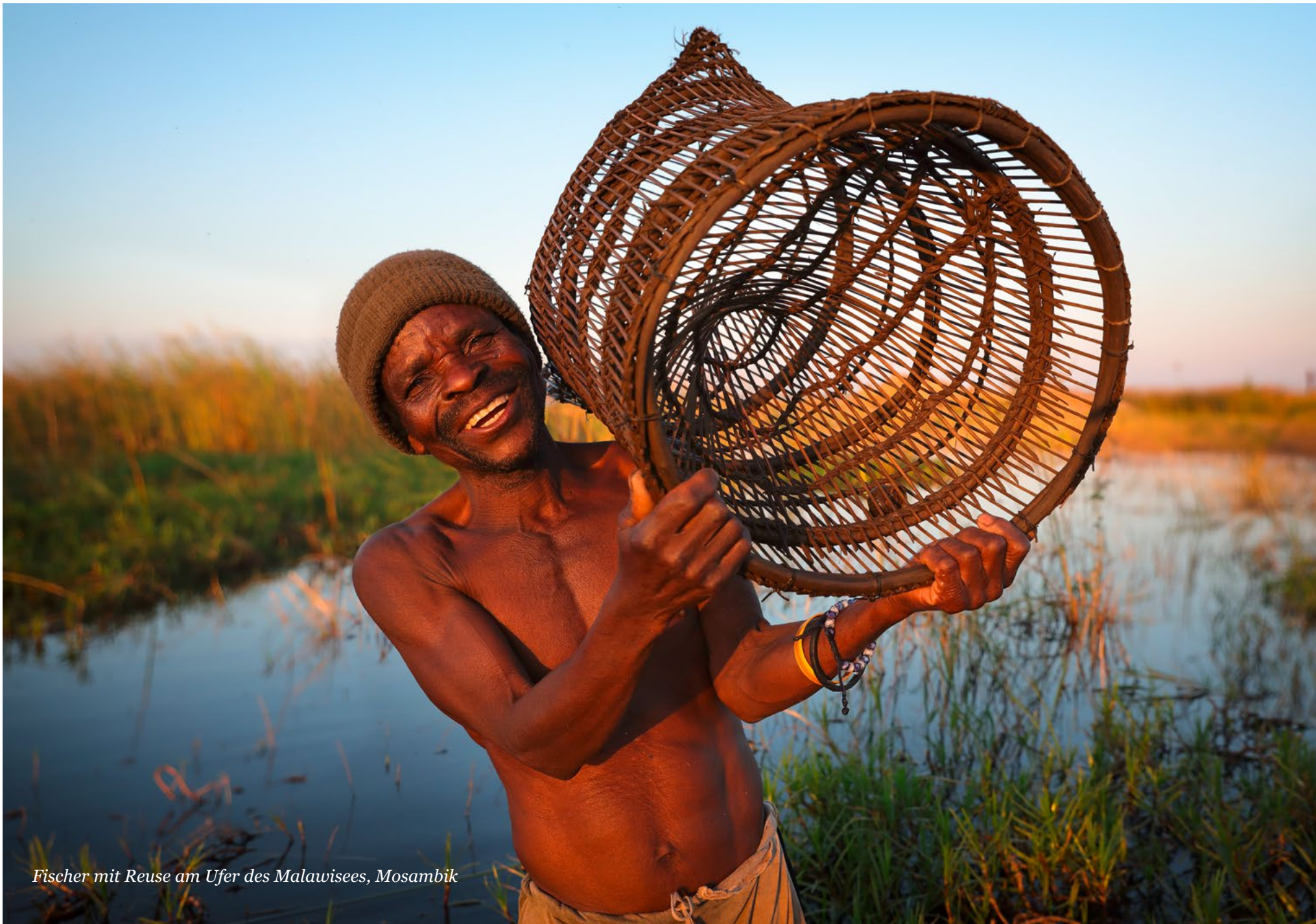
Fischer mit Reuse am Ufer des Malawisees, Mosambik