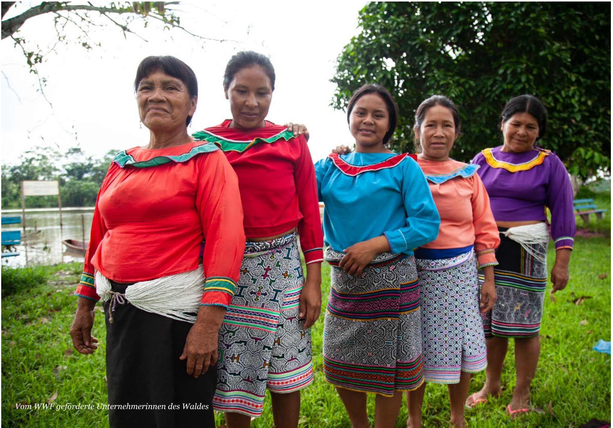
Vom WWF geförderte Unternehmerinnen des Waldes