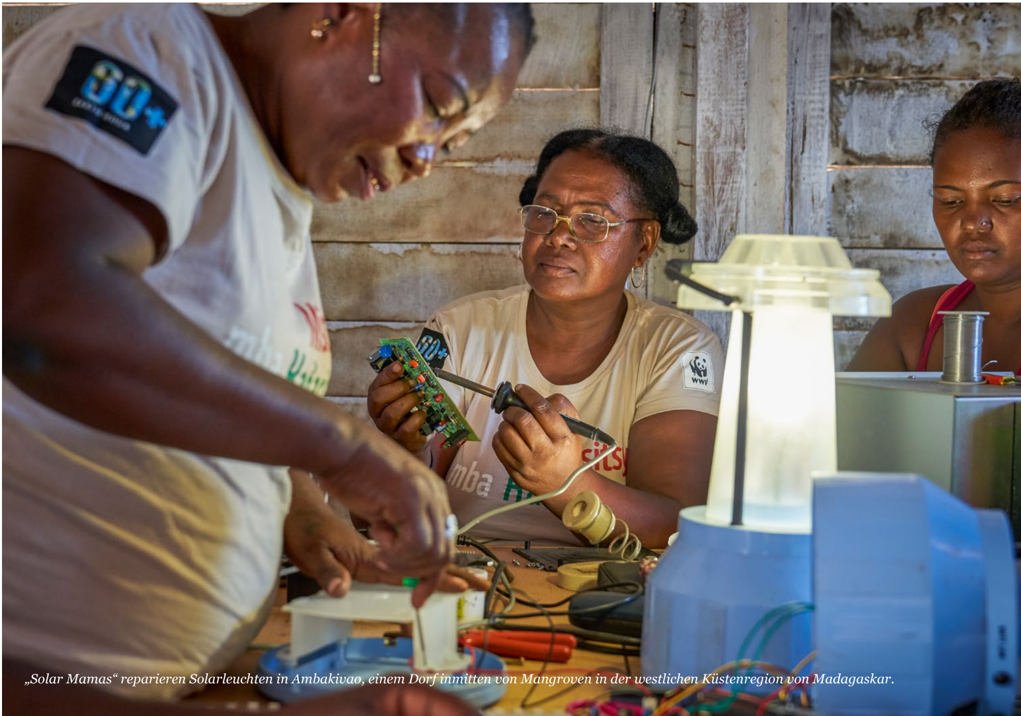
„Solar Mamas“ reparieren Solarleuchten in Ambakivao, einem Dorf inmitten von Mangroven in der westlichen Küstenregion von Madagaskar.