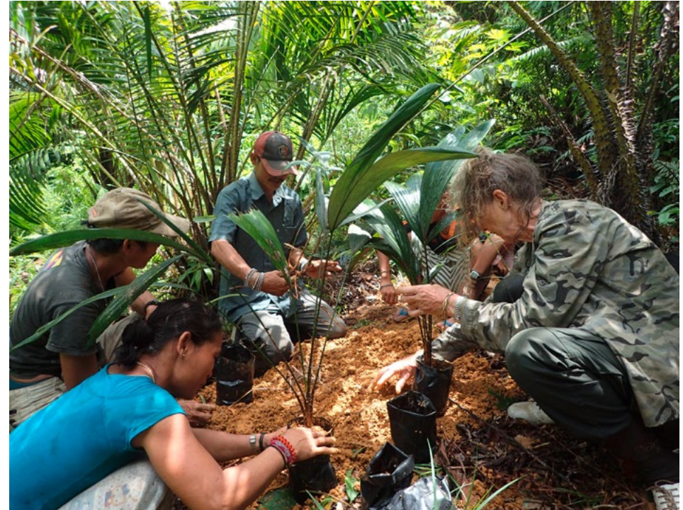
Pflanzung von Rattansetzlingen

Bei sämtlichen Projektaktivitäten stehen das Recht indigener Völker auf Konsultation und das Prinzip der freien, vorherigen und informierten Zustimmung (Free, Prior and Informed Consent, FPIC) im Zentrum der Aktivitäten. So wird sichergestellt, dass die lokalen Gemeinschaften ein gutes Verständnis für die Absichten des WWF haben, deren potenzielle Vorteile und Risiken selbst bewerten können, die Aktivitäten so gestalten können, dass Risiken reduziert und Vorteile gefördert werden und kollektiv abwägen können, ob sie den Aktivitäten zustimmen möchten oder nicht. So wird auch die Planbarkeit und